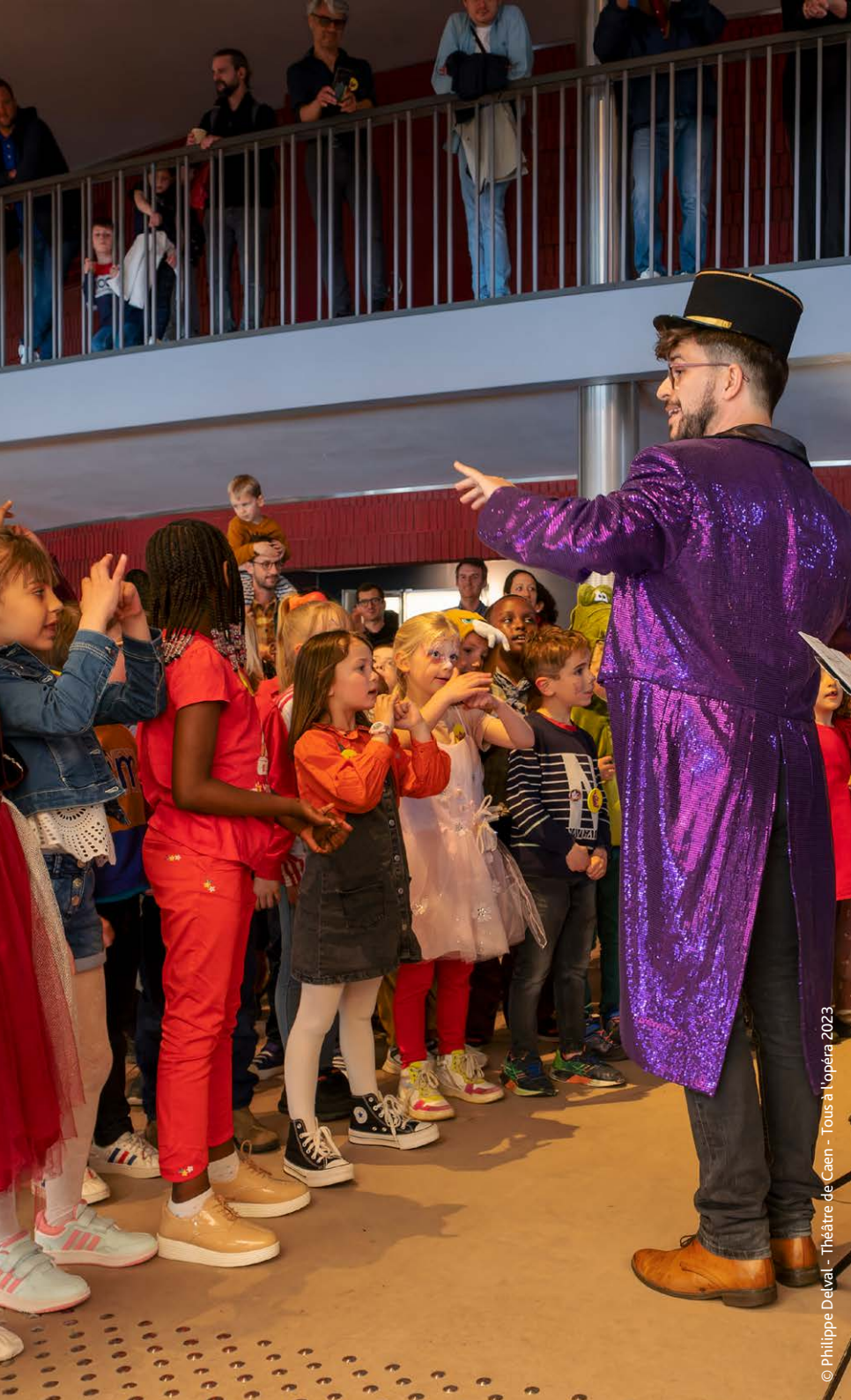
© Philippe Delval - Théâtre de Caen - Tous à l'opéra 2023