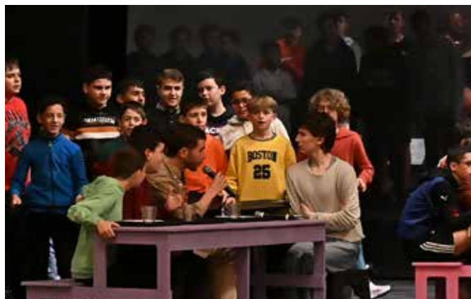
LES 2 LÉO, UN TOUR DE PASSE-PASSE, 2023