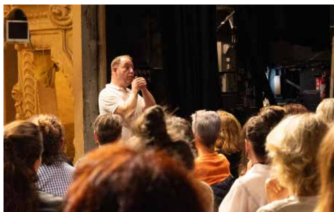
LES MÉMOIRES D'UNE SEIGNEURES, 2024