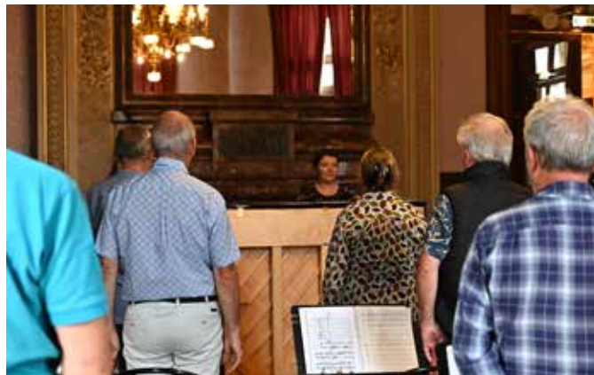
CARMEN [ROULOTTE], 2023

et le soutien de la Ville de Vichy, de Vichy Communauté, du Département de l'Allier, de la DRAC Auvergne-Rhône-Alpes, du Conseil régional et de fondations engagées dans l'égalité d'accès à la culture.