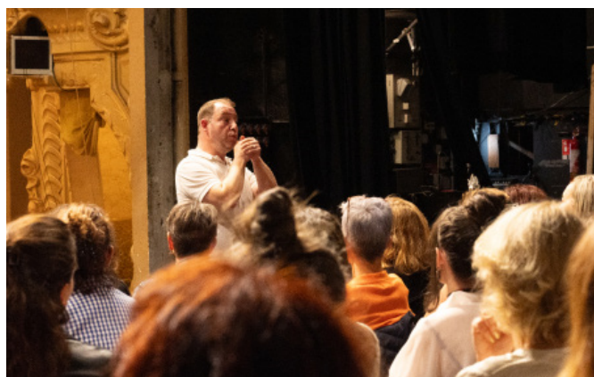
LES MÉMOIRES D'UNE SEIGNEURES, 2024