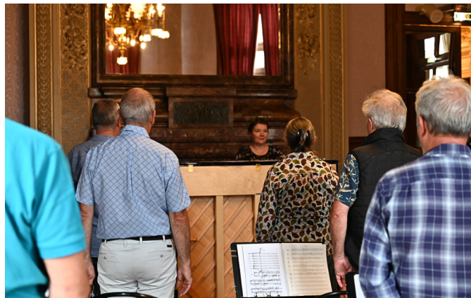
CARMEN [ROULOTTE], 2023

et le soutien de la Ville de Vichy, de Vichy Communauté, du Département de l'Allier, de la DRAC Auvergne-Rhône-Alpes, du Conseil régional et de fondations engagées dans l'égalité d'accès à la culture.