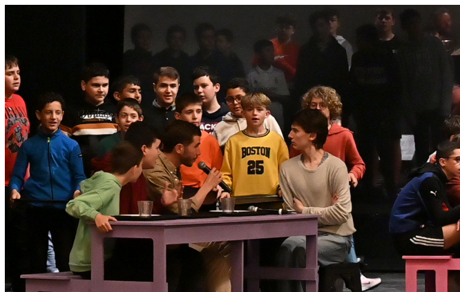
LES 2 LÉO, UN TOUR DE PASSE-PASSE, 2023